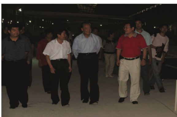
▲毛致用主席2008年10月1日视察天欣。