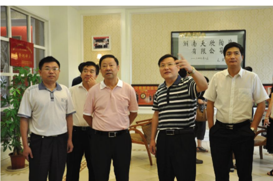
▲中共岳阳县委书记黎四清、岳阳县人民政府县长张中于等领导陪同老书记储波视察天欣科技公司。