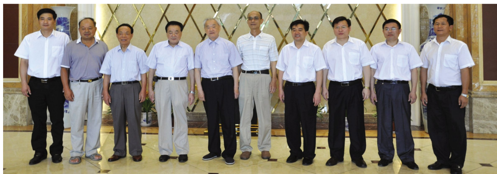
▲全国政协原副主席毛致用(左五)、省委副秘书长章彦武(左四)、湖南省商务厅厅长毛叙保(右五)、岳阳市人民政府原市长黄甲喜(左三)、岳阳市政协原副主席程谦逊(左二)、中共岳阳县委书记黎四清(右四)、岳阳县人民政府县长张中于(左一)、岳阳县委副书记汤小娥(右一)、湖南天欣集团董事长王五星(右三)、湖南天欣科技股份有限公司总经理童毓林(右二)合影。